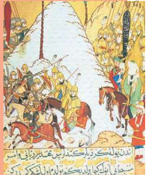
Ataque árabe a una villa. Miniatura árabe.

“Islam significa resignación o sumisión a Dios y musulmán quiere decir sumiso . Alá es uno y es lógico por tanto que todos sus servidores tengan el deber de imponerlo a todos los incrédulos, a los infieles. Lo que se propone no es, como se ha dicho, su conversión, sino su sujeción. Eso es lo que trae consigo. No piden nada mejor, después de la conquista, que apoderarse, como de un botín, de la ciencia y el arte de los infieles; los cultivarán en honor de Alá. Incluso tomarán de ellos sus instituciones en la medida en que puedan serles útiles. Por lo demás, los empujan a ello sus propias conquistas. Para gobernar el Imperio que han fundado no pueden basarse ya en sus instituciones tribales, igual que los germanos no pudieron imponer la suyas al Imperio romano. La diferencia estriba en que, dondequiera que estén, dominan. Los vencidos son sus súbditos, son los únicos que pagan el impuesto, están al margen de la comunidad de los creyentes. La barrera es infranqueable; no se puede producir ninguna fusión entre las poblaciones conquistadas y los musulmanes. ¡Qué enorme contraste con un Teodorico, que se pone al servicio de sus vencidos e intenta asimilarse a ellos!”