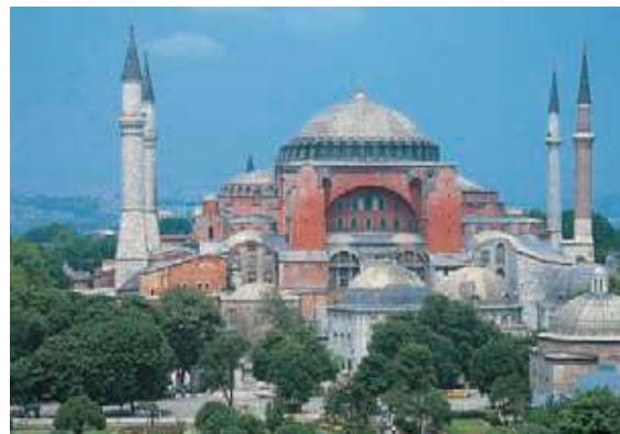
Iglesia de Santa Sofía.