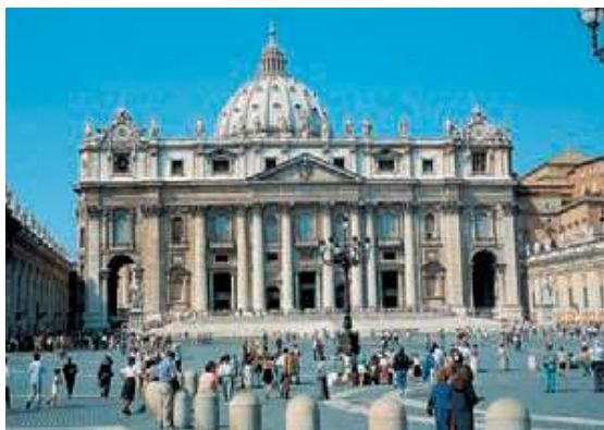
Basílica de San Pedro.

3 Observa cuidadosamente las imágenes. Luego, responde las preguntas en tu cuaderno.