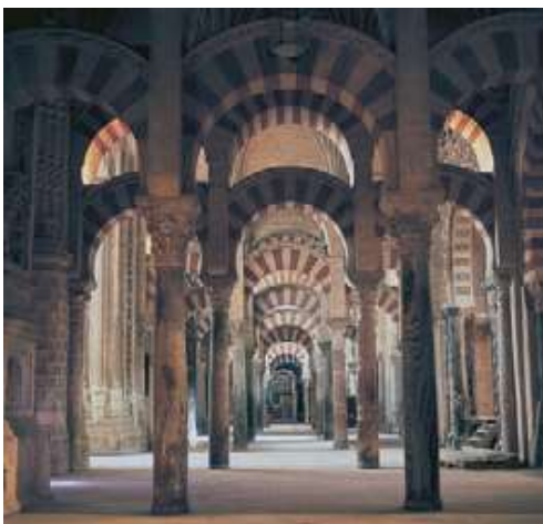
Interior de una mezquita.

El arte islámico se centró, especialmente, en el campo de la arquitectura. Entre los edificios musulmanes sobresalen la mezquita o el templo, el palacio sede de los gobernantes y el zoco o mercado. La mezquita es el edificio islámico por excelencia, pues es allí donde se lleva a cabo la obligación que todo musulmán tiene de realizar oraciones comunitarias. En el interior de la mezquita hay una gran sala de oración, dividida por columnas y arcos y un muro denominado “quibla”, orientado hacia la ciudad sagrada de La Meca, frente al cual se sitúan los orantes. Entre las mezquitas más bellas se destacan las de Damasco, Bagdad y el Domo.