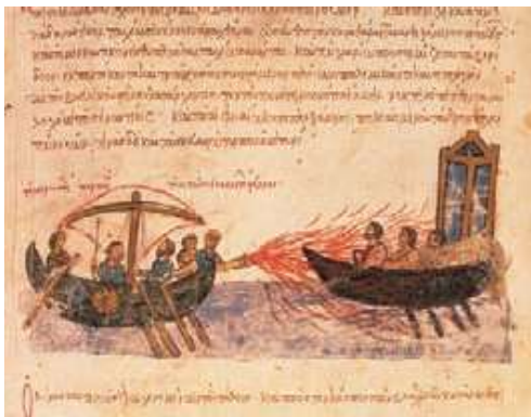
Fragmento de un poema de Al-Mutanabbi, considerado el poeta árabe más importante de todos los tiempos.

Gracias a los musulmanes las invenciones chinas, como el papel, la imprenta, la pólvora y la brújula, se difundieron por todo el mundo y por Europa. Fueron seguidores de los estudios de la historia, en los cuales sobresalió el sabio Aben Jaldum .