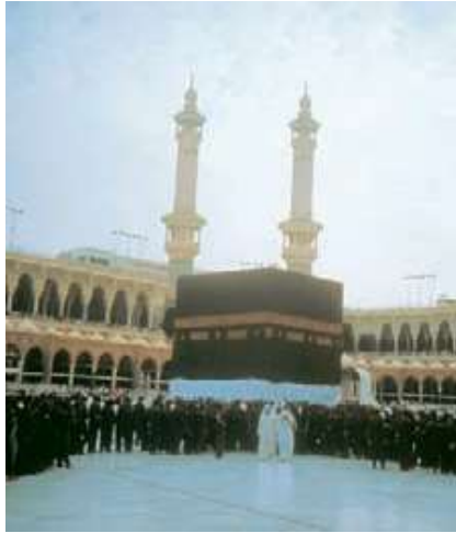
La Meca en un día de peregrinación, en el centro se ve la Kaaba.