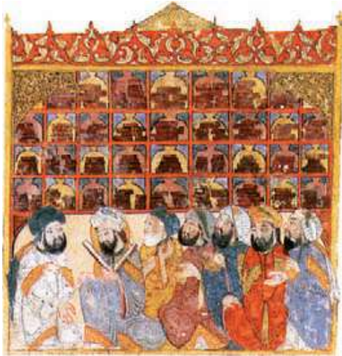
Biblioteca de Bagdad.