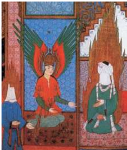
Aparición del arcángel Gabriel a Mahoma. Ilustración de un manuscrito persa del siglo XIV.

La nueva religión fue llamada islam , que significa “sumisión”, y sus seguidores fueron denominados musulmanes , “los sometidos a la voluntad de Dios”. Esta religión se fundamenta en cinco pilares que deben cumplir los creyentes: la profesión de fe basada en que solo hay un Dios y Mahoma es su profeta; la oración cinco veces al día; el ayuno en el mes de Ramadán; la limosna y la peregrinación a La Meca al menos una vez en su vida. Las enseñanzas de Mahoma quedaron plasmadas en el Corán , libro sagrado del islam.