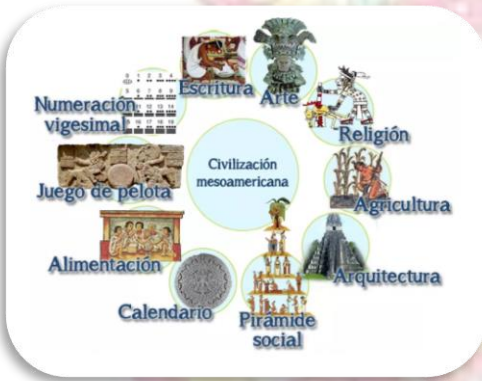
Ilustración 3 http://portalacademico.cch.unam.mx/alumno/historiademexico1/unidad2/mesoamerica/introduccion

A pesar de la extensión del territorio, las culturas Mesoamericanas guardaban características similares especialmente en el lenguaje, la escritura, la cosmovisión, la medición del tiempo con exactitud asombrosa, la utilización del calendario, los centros ceremoniales a los dioses (del maíz, la lluvia, el viento) así como las bases alimenticias con maíz, frijol, chile, los códigos de escrituras, la majestuosas pirámides y el particular juego de pelota como ritual. Otra de las características fue el uso de los nobles de túnicas de algodón opulentamente bordadas, lo cual contrastaba con las frazadas utilizadas por los demás pobladores.