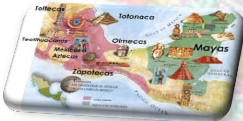
Ilustración 2 Ilustración 1 Ilustración 2 2 http://www.culturasmexicanas.com/2015/02/cultura-tolteca.html

encuentran las construcciones piramidales, los centros ceremoniales, las tumbas, sus herramientas (de cocina, caza y trabajo) hachas, joyas, figuras de jade, serpentina o barro, las cerámicas, las máscaras ceremoniales, las vestimentas fabricadas en algodón y demás fibras, penachos y otros objetos representativos de la vida cotidiana.