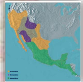
Ilustración 1 http://historiacuarto grado.blogspot.com/2012_08_01_archive.html

La palabra Mesoamérica, proviene del prefijo griego “ meso ” el cual significa en medio . La condición climática, la diversidad de su relieve (volcanes cubiertos de nieve, bosques de lluvias tropicales y áridas mesetas, grandes ríos y bosques) posibilitaron el asentamiento humano. Los habitantes cimentaron ciudades cuna de las maravillosas, enigmáticas y sorprendentes civilizaciones como: la Olmeca, La Maya, la Mexica o Azteca, la Teotihuacana, la Tolteca, la Mixteca, la Zapoteca, para mencionar algunas.