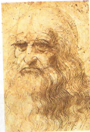
► Leonardo da Vinci.

Muchos estudiosos se preocuparon por establecer las proporciones ideales del cuerpo a través de la utilización de la matemática y de la geometría. Así mismo, en la medicina, avanzó la técnica del análisis y de la experimentación con cadáveres humanos. En este sentido los investigadores más famosos del Renacimiento fueron el flamenco Andrés Vesalio , en anatomía humana, el alemán Paracelso , en química y biología, y el español Miguel Servet , quien descubrió la circulación sanguínea.