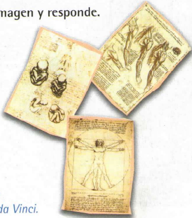
► Dibujos de Leonardo da Vinci.