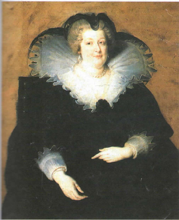
► Miembro de la nobleza renacentista francesa.

A medida que avanzó el proceso de concentración del poder y se consolidó la autoridad de los soberanos, sus cortes se transformaron en verdaderos centros de poder político. En ellas, los cortesanos rodeaban al príncipe tratando de ganar sus favores. Baltasar de Castiglione escribió, a principios del siglo XVI, una obra en la que desarrolló, a modo de modelo, los distintos aspectos necesarios para ser un buen cortesano . Este nuevo hombre debía ser una síntesis de pensamiento y acción, de caballerosidad y de arrojo. Debía dominar los ejercicios nobles como el salto, la carrera, la natación, la lucha...; había de ser un buen danzarín y un jinete consumado; debía conocer varios idiomas, entender de literatura y de artes plásticas, y poseer cierto virtuosismo práctico en música.