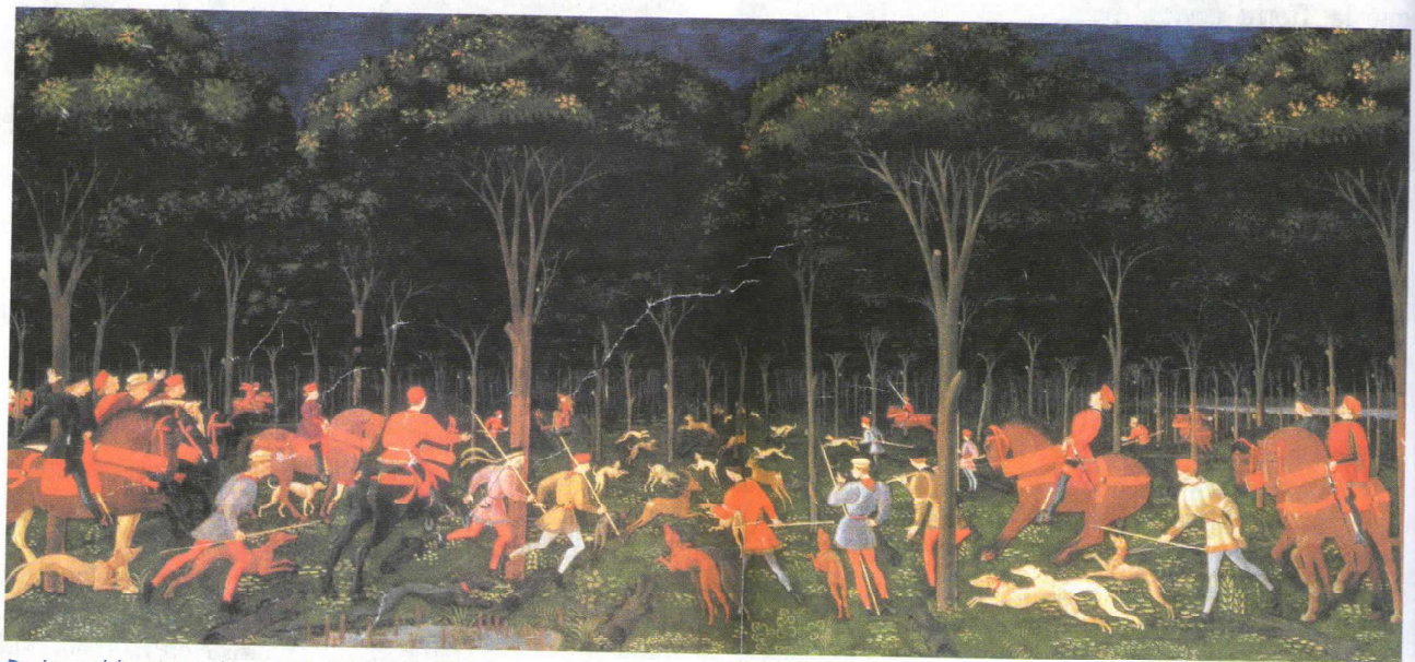
► La nobleza gozaba tanto del lujo como de la naturaleza.