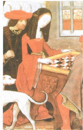
► Retrato de la reina Margarita de Navarra, una mujer educada.

Esta idea, sin embargo, fue afirmándose muy lentamente y durante el Renacimiento sólo se beneficiaron las hijas de los humanistas. En Italia, por ejemplo, los humanistas iniciaron tanto a sus hijos como a sus hijas en literatura y filología.