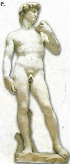
► David. Escultura de Miguel Ángel Buonarrotti.