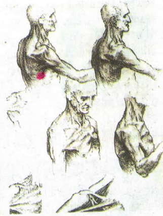
► Dibujos de anatomía de Da Vinci.