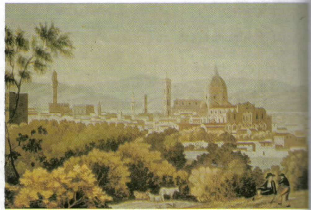
► Panorámica de Florencia en el Renacimiento.

La teoría política de este período llegó a su culminación con Nicolás Maquiavelo , quien revolucionó las ideas políticas de la época. En su famosa obra, El Príncipe , realizó novedosos análisis acerca de los recursos con los que había de contar un príncipe para conseguir, aumentar y conservar el poder. Afirmó que el soberano podía pasar por alto cualquier principio moral, ético o religioso, con tal de conseguir el bienestar de su comunidad; es decir, según Maquiavelo, "el fin justifica los medios". El político, por lo tanto, debía usar cualquier medio siempre y cuando obtuviera éxito. La meta final era, sin dudar, la razón del Estado.