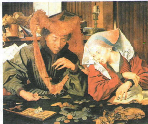
► El cambista y su mujer.