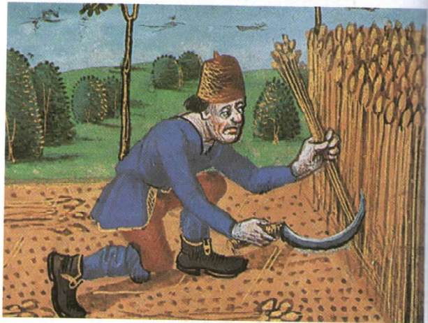
► El campesinado se mantuvo en condiciones similares a las de la Edad Media.

La burguesía , que surgió como consecuencia del desarrollo de la industria y del comercio. Las diferencias de riqueza entre ellos eran marcadas. Por un lado, estaban los hombres de negocio que formaban una verdadera aristocracia urbana . Por el otro, había hombres preparados que ejercían profesiones liberales como abogados, médicos, etc. De entre estos se reclutó la burocracia de los nuevos Estados. Por último, estaban los que vivían de la práctica de algún oficio, los artesanos . Los campesinos eran el grupo más numeroso y, a su vez, más desamparado y pobre.