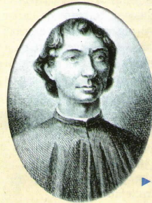
► Nicolás Maquiavelo.

CÉSAR BORGIA, EL INSPIRADOR DE MAQUIAVELO