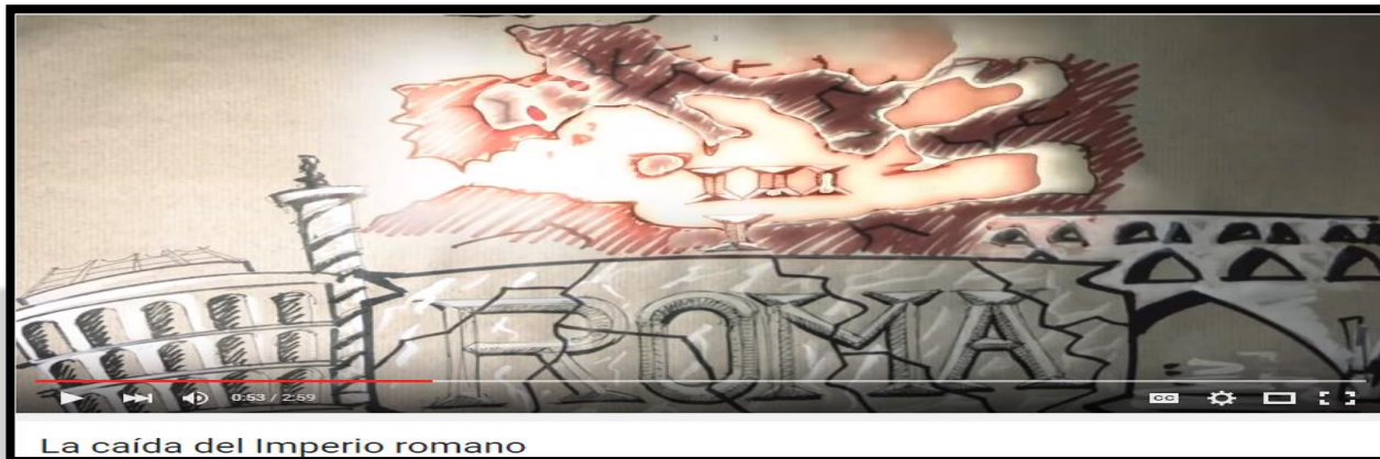
Ilustración 2 https://www.youtube.com/watch?v=Lhko_AiDx2w (Ver video de la caída del Imperio romano)

Al fijar límites del Medievo se ubicarían entre la fundación de Constantinopla, en el 330, y su conquista por los otomanos, en 1453, por lo que, en consecuencia, la Edad Media coincidiría en el tiempo con el llamado Imperio romano de Oriente. Resulta muy curioso que ese imperio, el que se creara en torno a Constantinopla y al que habitualmente llamamos bizantino, la antítesis del Occidente bárbaro medieval, nos puede resultar de utilidad para delimitar cronológicamente esta etapa histórica.